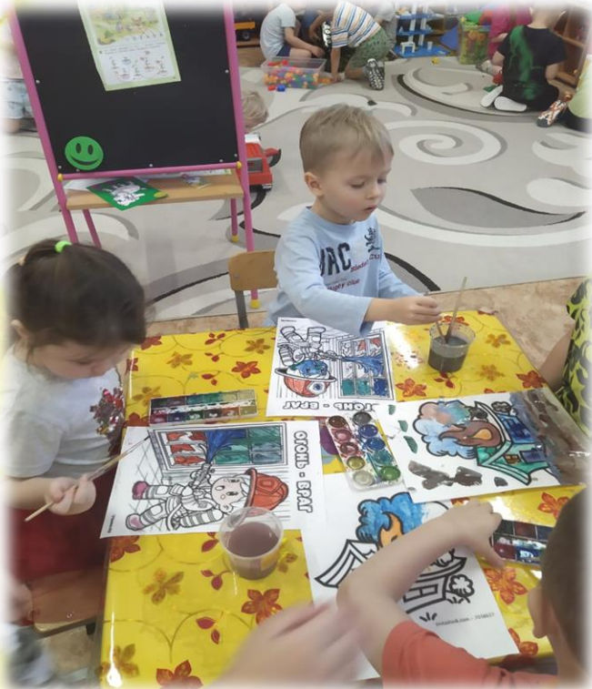
Рисование «Пожар дома»