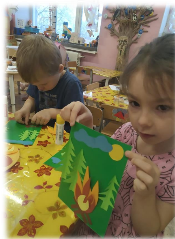
Аппликация «Пожар в лесу»