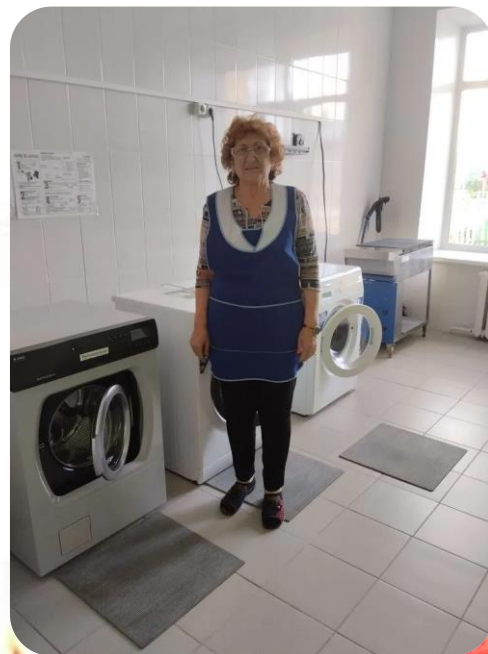
В прачечную (знакомство с работой стиральной машины)»