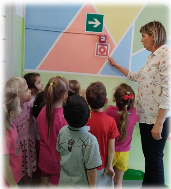
Знакомство со знаками пожарной безопасности