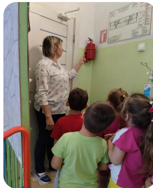
Знакомство с уголком противопожарной безопасности