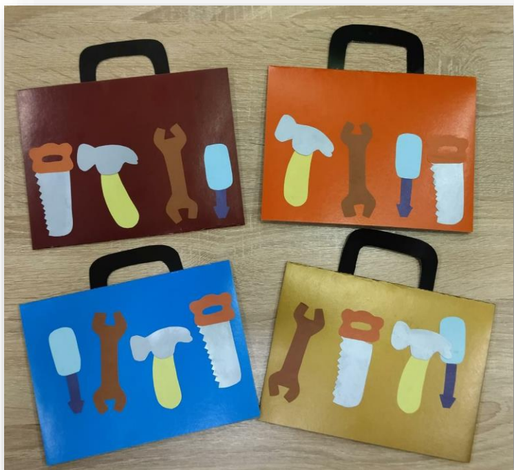
Аппликация «Ящик с инструментами»