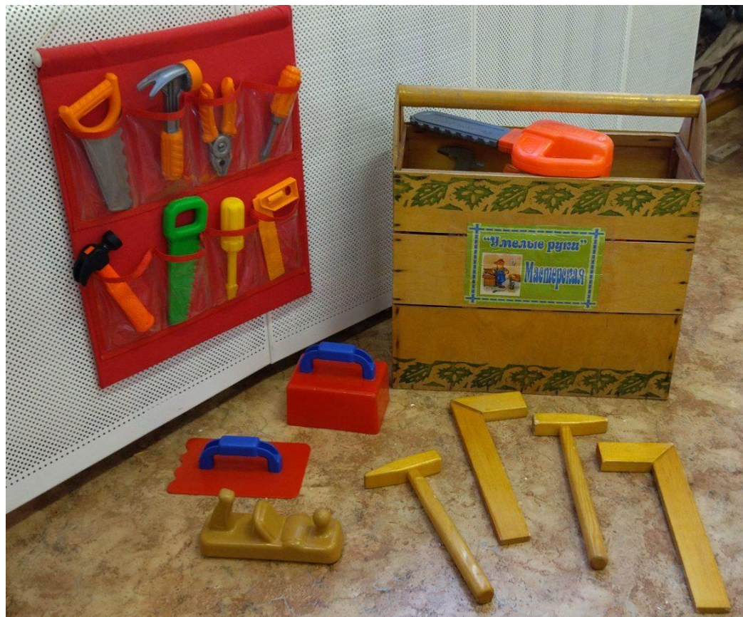
Изготовление атрибутов для сюжетно – ролевой игры «Строители»