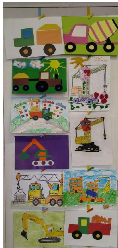
Выставка работ «Строительная техника»