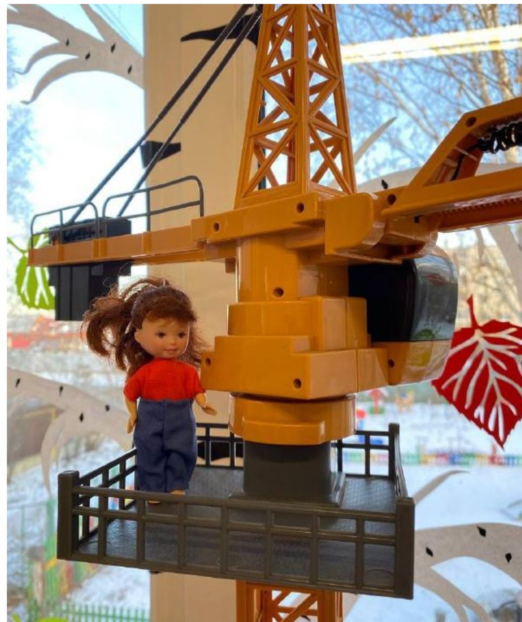
Продукт проекта - макет «Строительная площадка»