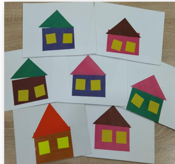
Аппликация «Домик с инструментами»