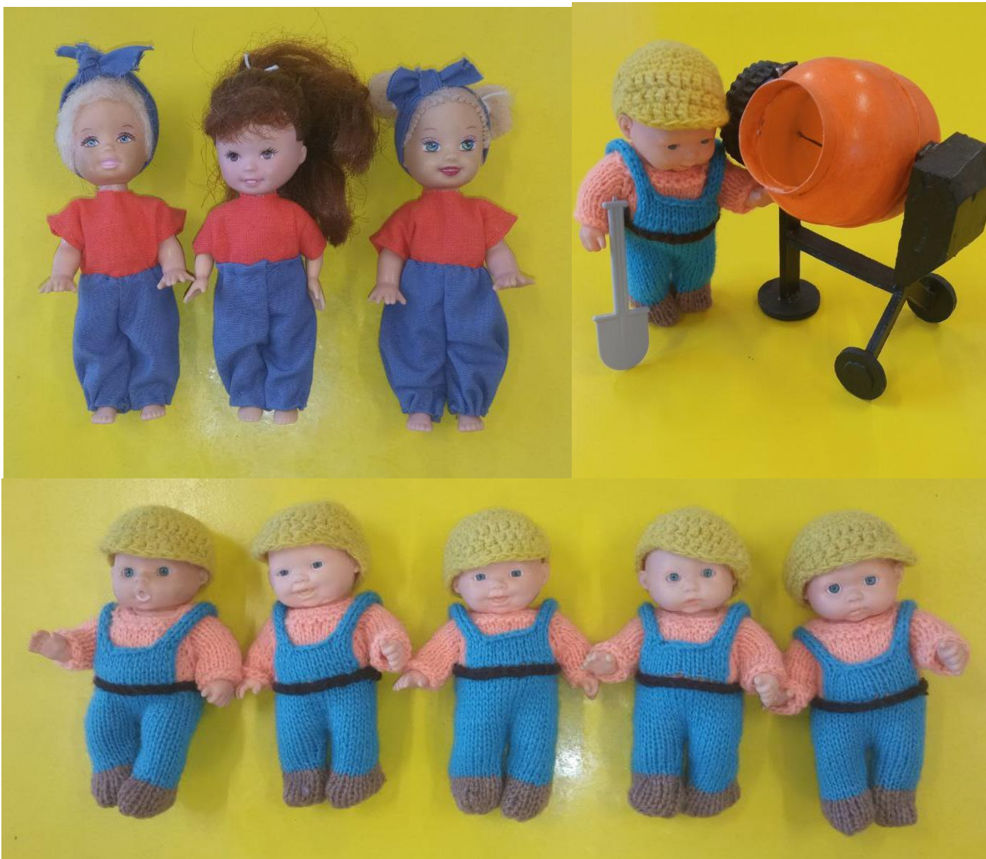
Изготовление спецодежды и спецтехники для строителей